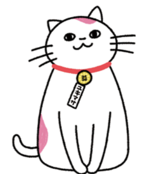
行政書士会公式キャラクター ユキマサくん