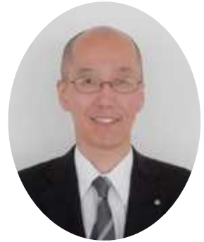
兵庫県淡路県民局長

県民局におきましても、はじまりの島としての「歴史・文化」、1300年の昔から御食国とされた「食」、世界遺産登録を目指す鳴門海峡の渦潮をはじめとする「豊かな自然」など、淡路島の強みに一層の磨きをかけ、世界中にその魅力を発信してまいりますので、引き続き、格別のご理解とご協力を賜りますようお願い申し上げます。