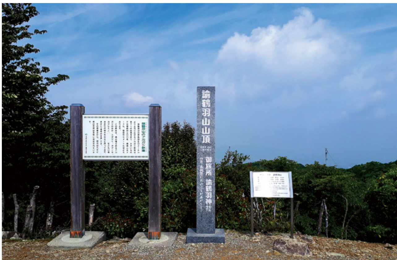
(淡路島最高峰諭鶴羽山山頂)